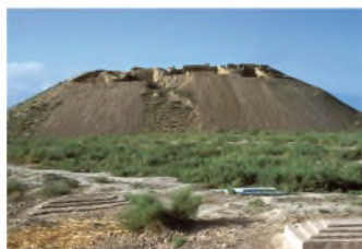
Forteresse sassanide au sommet du Grand Tepe, vue du nord, pendant les fouilles, [1967-1975]. (Cote : TT15/15)