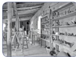
Rangement et analyse du matériel issu des fouilles, s.d. (Cote : TT12/25)

Auteurs : Elisabeth Bellon, Sophie Montel en collaboration avec Serge Cleuziou. Contact : Elisabeth Bellon Service des archives scientifiques Archives Tureng Tepe. Jean Deshayes, 1960-1990.