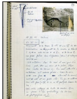
Page d'un carnet de fouille de la campagne 1975. (Cote : TT3)