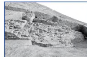
Extrémité de la terrasse ouest, vue sud, Grand Tepe, 1977. (Cote : TT12/1)