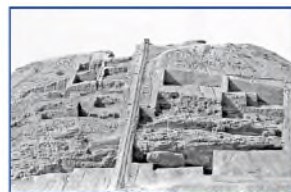
Vue des sondages du Grand Tepe, face sud, 1975. (Cote : TT12/1)