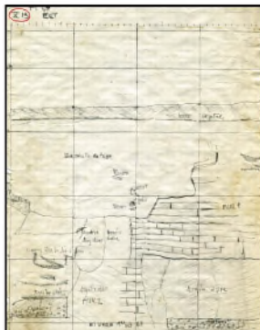
Relevé des vestiges localisés au sommet du Grand Tepe (carré X 13, est), 1967. (Cote : TT3)