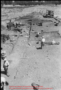
Así fueron de la Misión del Sur donde se trabajó durante los años 1970. El terreno, hoy en día, pertenece al Estado de Yucatán.