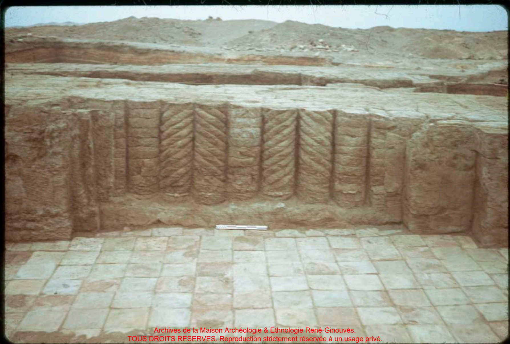
Archives de la Maison Archéologie & Ethnologie René-Ginouvès. TOUS DROITS RESERVES. Reproduction strictement réservée à un usage privé.