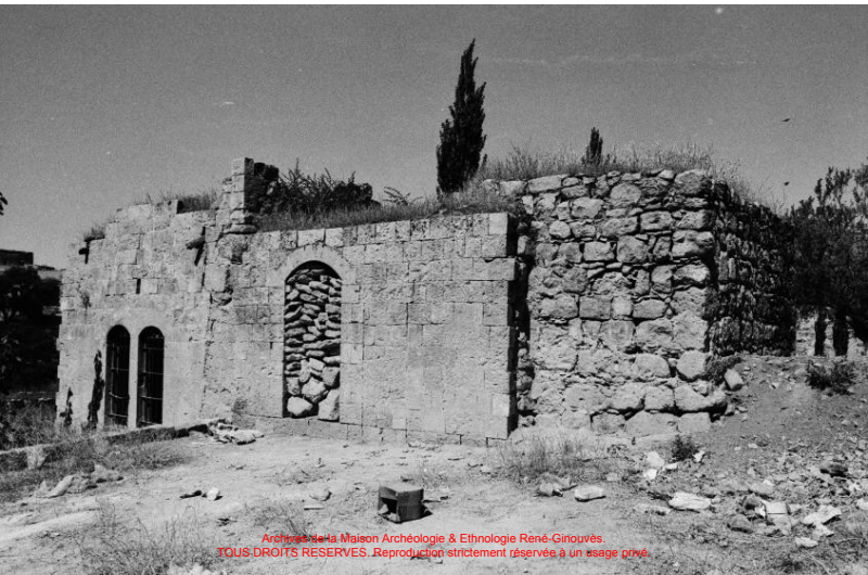
Archives de la Maison Archéologie & Ethnologie René-Ginouvès. TOUS DROITS RESERVES. Reproduction strictement réservée à un usage privé.