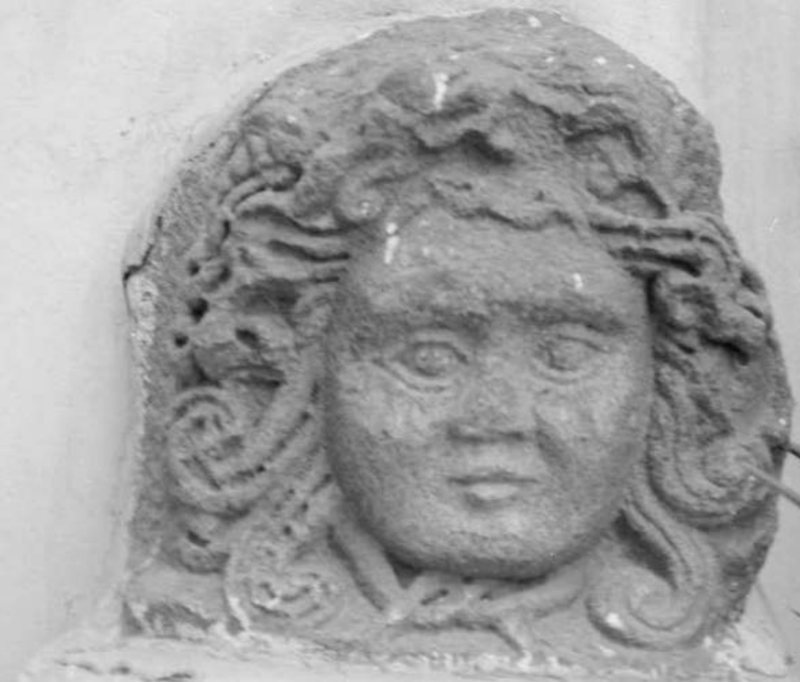
Archives de la Maison Archéologie & Ethnologie René-Ginouvès. TOUS DROITS RESERVES. Reproduction strictement réservée à un usage privé.