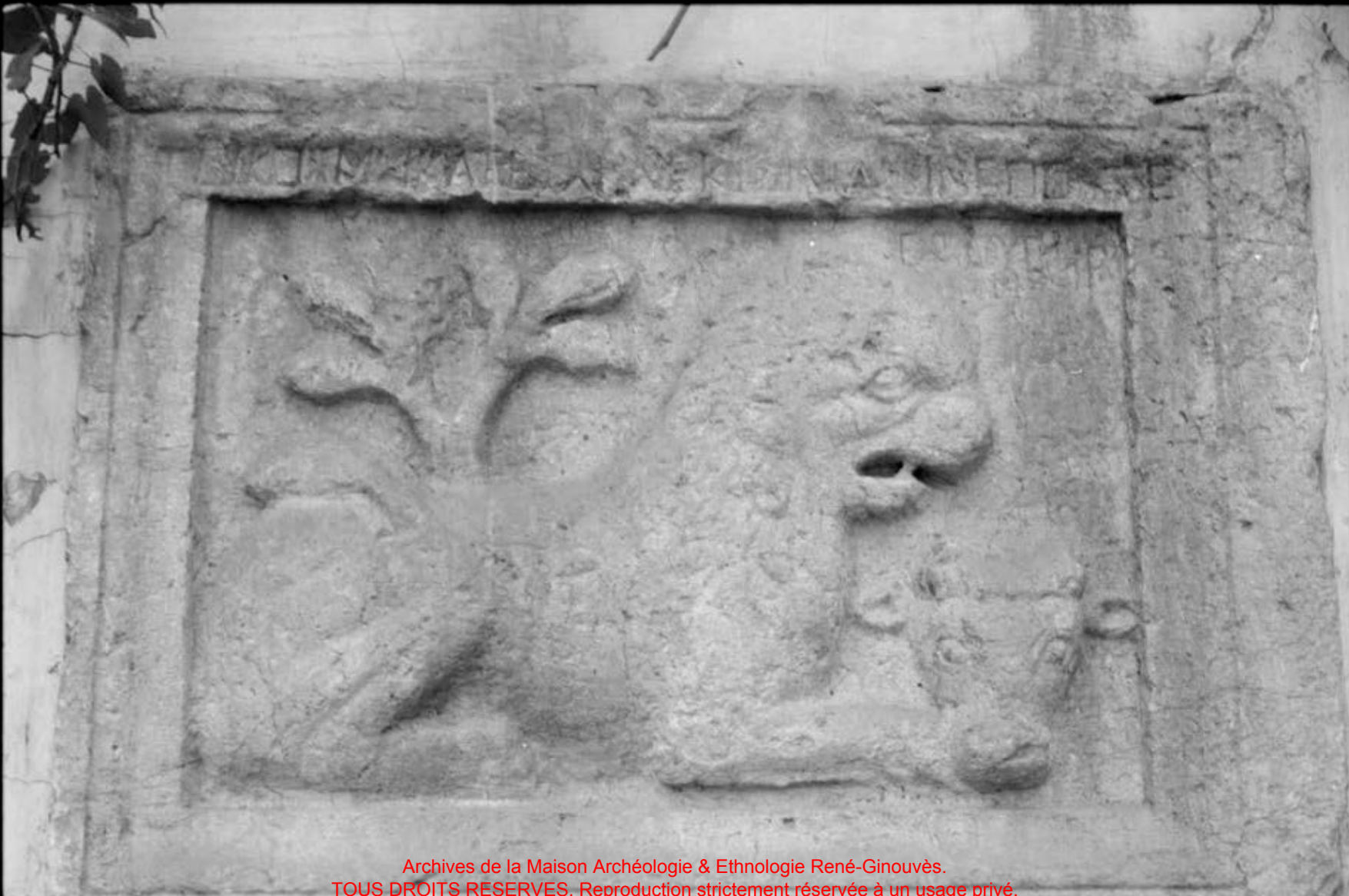
Archives de la Maison Archéologie & Ethnologie René-Ginouvès. TOUS DROITS RESERVES. Reproduction strictement réservée à un usage privé.