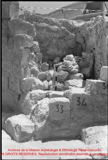
Archives de la Maison Archéologie & Ethnologie René-Ginouvès. TOUS DROITS RESERVES. Reproduction strictement réservée à un usage privé.