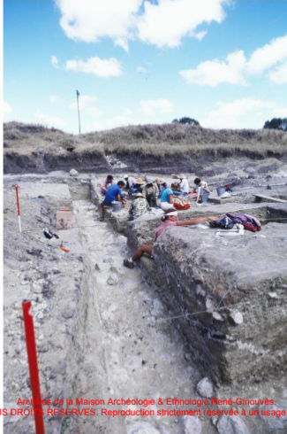
Archives de la Maison Archéologie & Ethnologie René-Ginouvès. TOUS DROITS RESERVES. Reproduction strictement réservée à un usage privé.