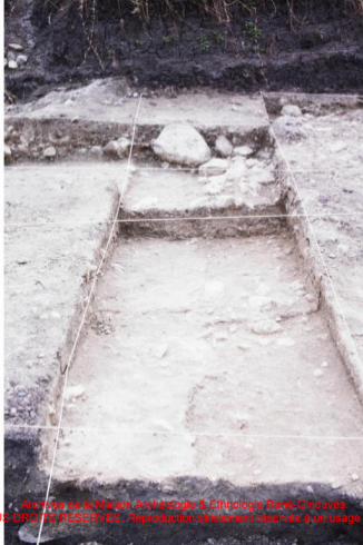
Archéologie de la Maison Archéologie & Ethnologie René-Ginouvès. TOUS DROITS RESERVES. Reproduction strictement réservée à un usage privé.