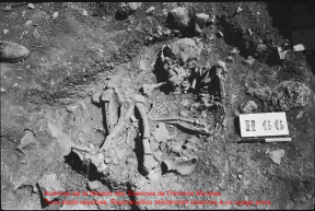
Archives de la Maison des Séances de l'Homme Moderne. Tous droits réservés. Reproduction strictement réservée à un usage privé