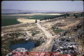
Entrée de la Maison des Sciences de l'Université Maroua. Vue d'une rivière. Reproduction autorisée sous réserve d'un usage privé.