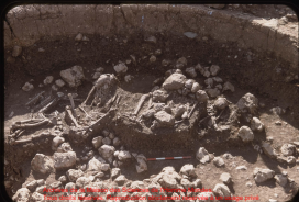
Archeologia do Museu das Ciências da História de São Paulo. Foto de João de Deus. Reprodução estritamente reservada a um usage privado.