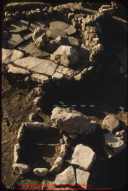
Archaeological site showing a stone-paved area with a central circular feature. The red scale bar indicates a length of 1 meter. The blue dashed line is a reference line.