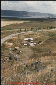
Aspetto da la Marina per l'altipiano del Tugay, Marocco. Una delle rovine, l'antico tempio di Idris, è ancora in piedi.