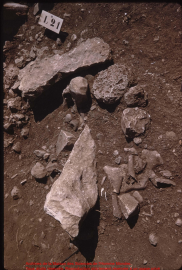
Restos de la Cultura de San Juan de Chiriquí, Panamá. Una de las herramientas más características de esta cultura es el cuchillo de piedra.