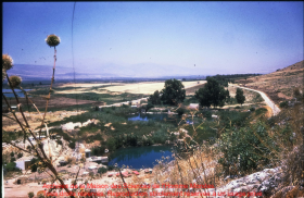
View from the hillside, looking down at the valley. The road is visible on the right side of the image. The text at the bottom of the image reads: "View from the hillside, looking down at the valley. The road is visible on the right side of the image." This text is repeated twice in red font.