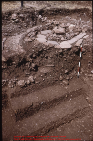
Restos de la Muralla de los Reinos de Chiriquí y Chiriquí. Tronco de la muralla, fragmentos de cerámica y otros restos de un antiguo pueblo.