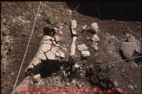
Archives de la Maison des Sciences de Monaco-Monaco Tous droits réservés. Reproduction strictement réservée à un usage privé