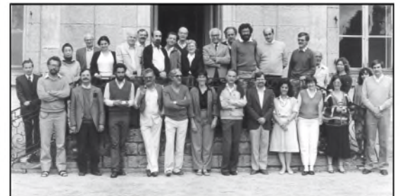
Rencontre internationale de Cirey-les-Bellevaux, 1985. (Non coté)

Auteurs : Elisabeth Bellon, Geneviève Dollfus, Odile Le Brun, Jean Perrot.