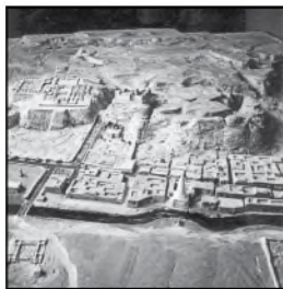
Maquette du site, 1974. (Cote : JP1343)