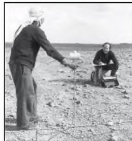
Prospection électrique sur le tell des Artisans (A. Hesse, S. Renimel), 1974. (Cote : JP1342)

A u VIII e siècle, sur le tepe oriental de Suse connu sous le nom de « Ville des artisans », les susiens édifient leur première mosquée, l'une des plus anciennes d'Iran. Elle devient alors le centre de la cité médiévale de Suse. Entre 1976 et 1978, les fouilles conduites par M. Kervran mettent au jour la Grande Mosquée, un couvent ou « Khanqah » contemporain et des maisons d'habitation.