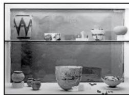
Vitrines du musée rénové et agrandi par la mission, 1974. (Cote : JP1345)