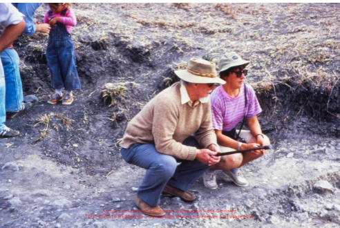
Average of 4 Months of Growth & Erosion Rates Group's TOUR 000116 REARRIVES. San Diego 2004