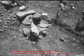
Archives de la Maison des Sciences de l'Homme Mondes. Tous droits réservés. Reproduction strictement réservée à un usage privé