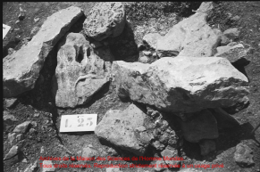
Échantillons de la Mission des Sciences de l'Homme Mondes. Tous droits réservés. Reproduction strictement réservée à un usage privé.